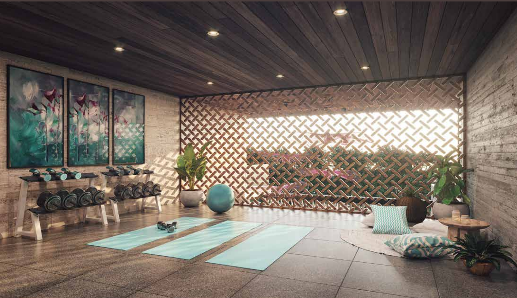
YOGA SITE & GYM