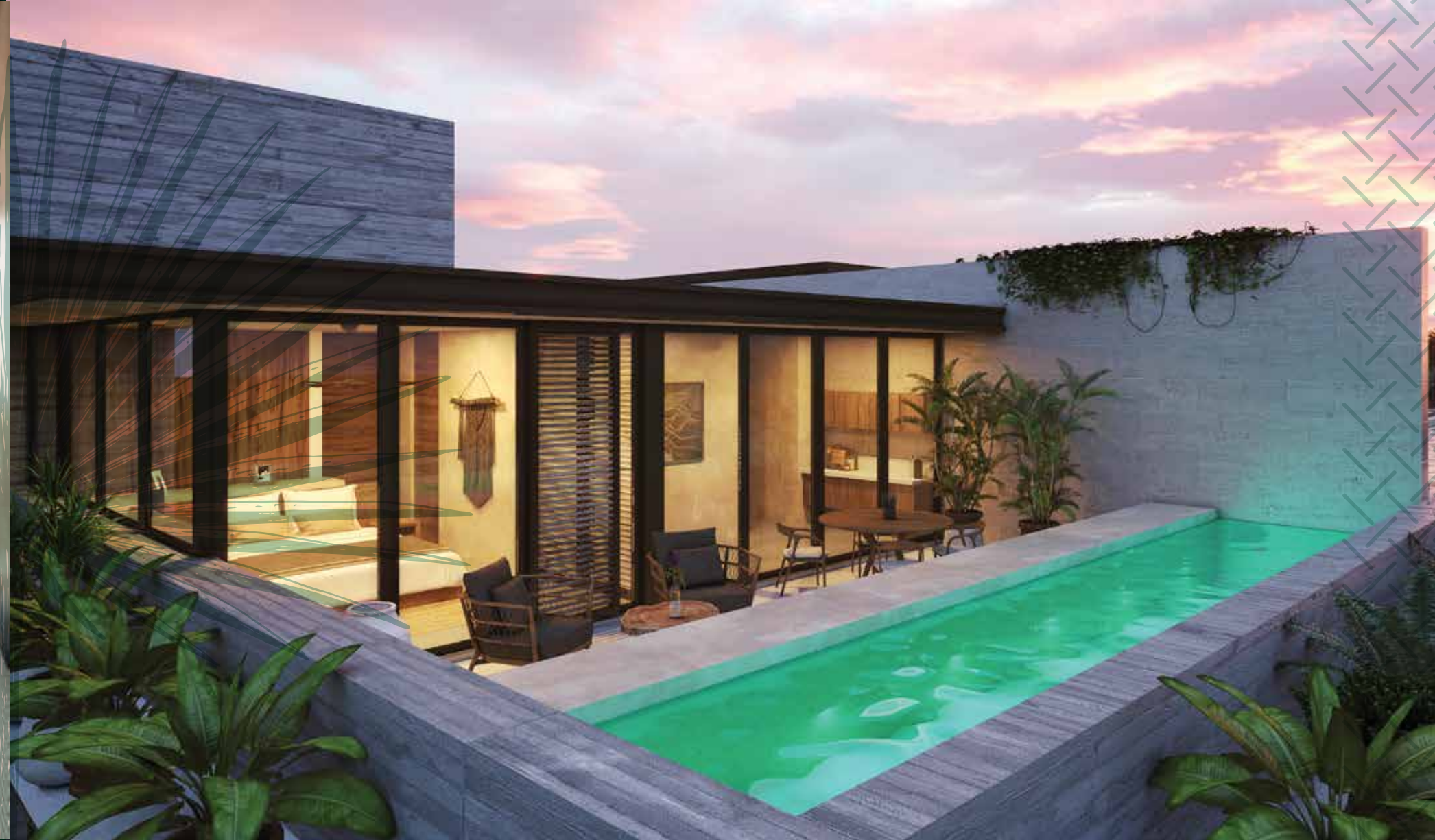
PENTHOUSE ROOFGARDEN, POOL & MASTER BEDROOM