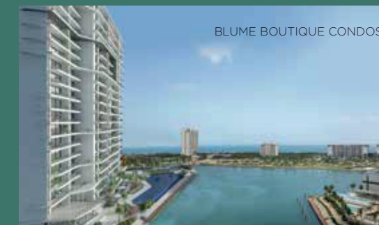
BLUME BOUTIQUE CONDOS