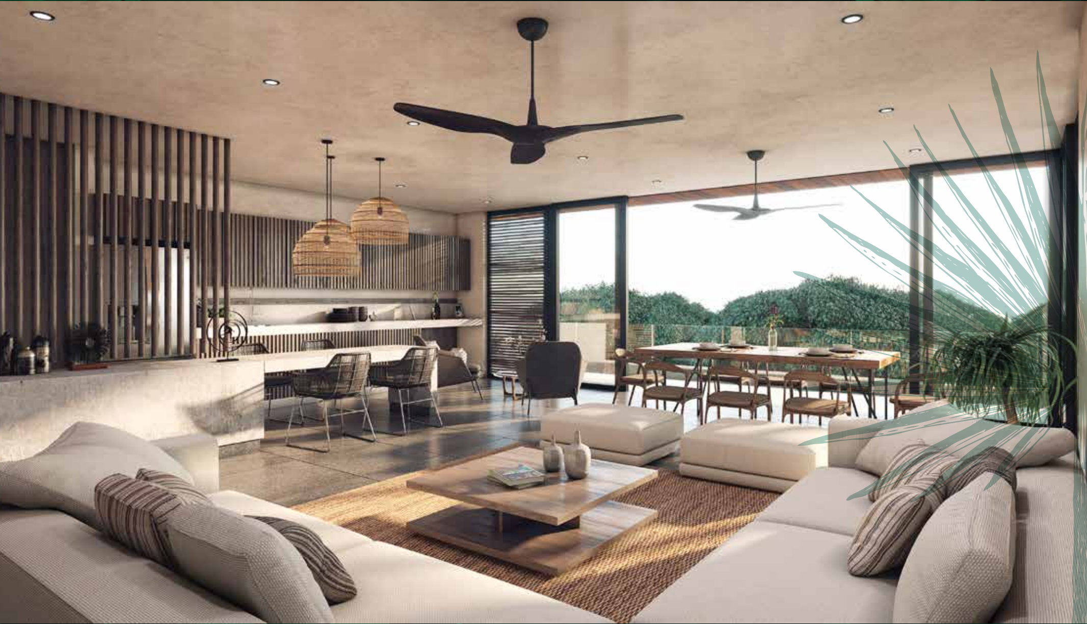
PENTHOUSE LIVING ROOM