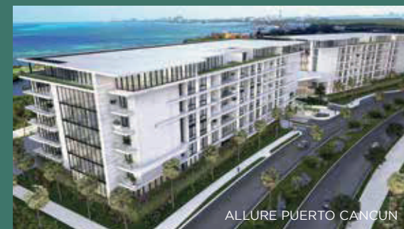
ALLURE PUERTO CANCUN